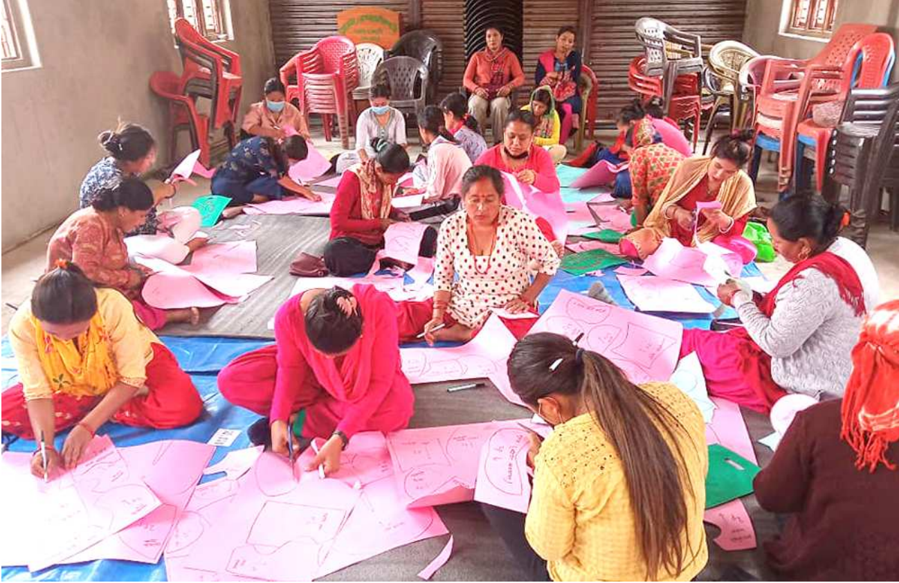
गरीबी निवारणका लागि लघु उद्यम विकास कार्यक्रम : 'आर्थिक समृद्धिको आधार, लघु उद्यम मार्फत रोजगार' भन्ने नाराका साथ म्याग्दे गाउँपालिकाले वडा नं. ४ मा आयोजना गरेको गुडिया तथा सजावटका सामाग्री निर्माण तालिममा सहभागी स्थानीय महिलाहरू। तस्विर : भञ्ज्याङ